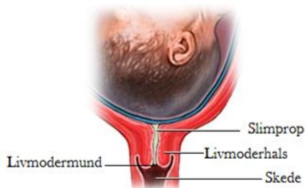
Umoden, lang livmoderhals og lukket livmodermund.

Du vil først blive undersøgt indvendigt gennem skeden, for at vi kan finde ud af, hvordan din fødsel bedst kan sættes i gang. Vi vurderer livmoderhalsens længde og konsistens, samt hvor åben livmodermunden er. Dette fortæller noget om, hvor klar kroppen er til at gå i fødsel. Livmoderhalsen er normalt 3 centimeter lang, den er fast i konsistens, og livmodermunden er lukket. Sidst i graviditeten vil livmoderhalsen hos de fleste kvinder blive kortere og blødere, og livmodermunden vil måske åbne sig lidt. Jo mere moden livmoderhalsen og livmodermunden er, jo mindre skal der til for at sætte fødslen i gang.