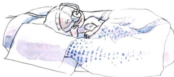
Udstyret omkring mig støtter mig, så længe jeg har brug for det.

Jeg kan have brug for hjælp til at trække vejret. Det kan være ved at få luft blæst gennem små plastikrør i mine næsebor (nasal CPAP) eller ved at få tilskud af ilt gennem små plastikslinger i næsen.