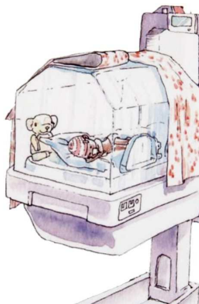
Jeg sover i en kuvøse eller en lun vugge, som holder mig varm, ligesom en livmoder ville gøre.

Dit for tidligt fødte barn kan se så lille og hjælpeløst ud. Men i virkeligheden kan dit barn allerede fortælle dig mange ting, og du kan svare med kærlighed og tryghed ved at deltage aktivt i samspillet.