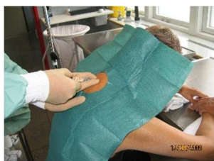
... før medicinen indsprøjtes i epiduralrummet med en kany- le.