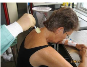
Lægen desinficerer huden i nakken og lokalbedøver...