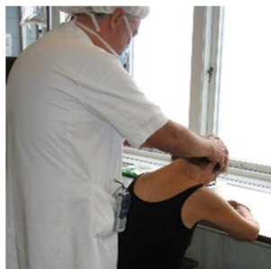
Ved behandlingen sidder du i en foroverbøjet stilling.