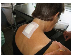
Et plaster dækker indstiksstedet.