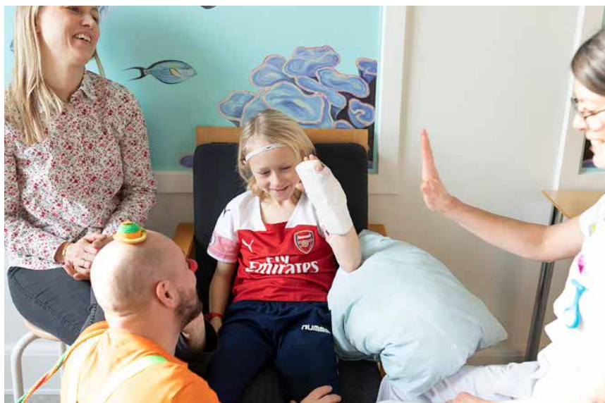
Du klarede det. Du er sej.