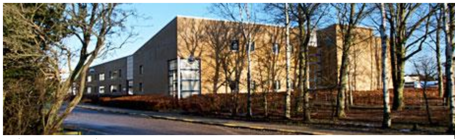
Fysio- og Ergoterapien

Aftale mellem Træningsenheden Hjørring og Fysio- og Ergoterapien, Regionshospital Nordjylland, Hjørring